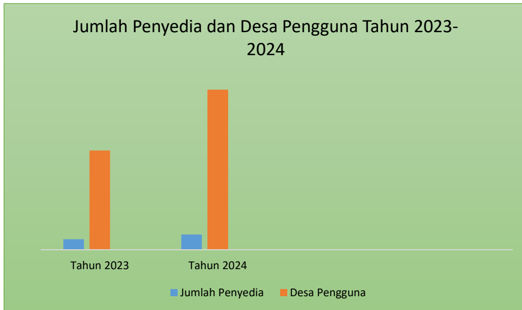
Grafik 1. Jumlah Penyedia dan Desa Pengguna Tahun 2023-2024